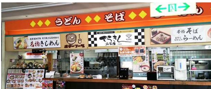
【店頭看板用シート 2種類】