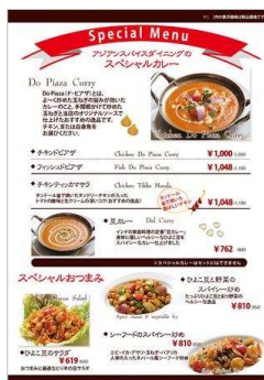
スペシャルメニュー