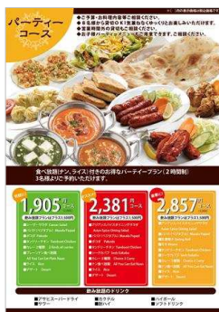
パーティーコース